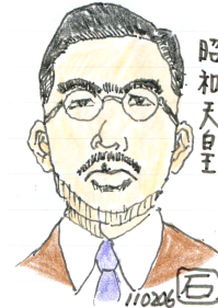
昭 初 天 皇 自 主

当時、中国で 北伐 が進展し、それにともなって反帝国主義運動が高まるなか、三井や 政友会 などから 憲政会内閣 の 幣原外交に対する不満 が強くなっており、枢密院は 対中国強硬外交への転換を期待して 倒閣へと動いたのである。